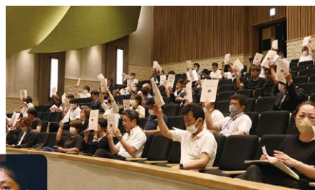
議案の承認の意を表す会場のみなさん