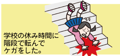
学校の休み時間に階段で転んでケガをした。

学校内外でのケガや、偶然な事故による法律上の損害賠償責任など、お子さまを取り巻く様々な事故のリスクに対応します。