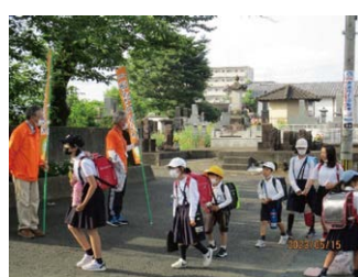
民生委員によるあいさつ運動

に、学力向上を推進しています。保護者は、学校教育に対してPTA役員を中心に様々な活動に協力的です。合志市では、毎月15日を「こぼ教育の日」としています。本校では、その日を「しあわせハッピーDAY」とし、月ごとにミッション（5月はお手伝い）を設定し、遂行をとおして各家庭でことばを交わす機会としています。このように本年度は、学級PTAや各専門委員会の活性化を図りながら、学校と保護者間の連帯を深める取組みの企画、運営を行っています。