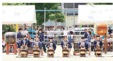
運動会で披露した水軍太鼓