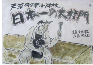
地域の方が伝統を残すため作成された紙芝居

今津小学校は、上天草市の中央に位置する松島町にある小学校です。小学校の歴史は古く、明治8年に合津・今泉小学校簡易科が設置され、明治20年に合津小学校並びに今泉小学校と改称後、明治31年に両校が合併し今津尋常小学校と改称、昭和22年に今津小学校が設立されました。平成22年には福合小学校との合併が行われ今日に至っています。 本校の令和5年度学校教育目標は、「夢の実現への成長〜かしこく・やさ