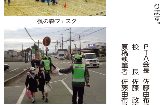
地域ボランティアの方々による旗振り活動

です。通学時間帯の交通量がとても多いこともあり、毎朝の通学時に、地域のボランティアの方や民生委員・保護者の方々が所定の場所で、子どもたちの登校を見守っています。 2つ目は、『楓の森フェスタ』の開催です。何かPTAとして子どもたちに楽しんでもらえるイベントができないかという思いから、昨年度初めて開催いたしました。このイベントはボランティアを募り、企画から運営まで全てをまとっていただいた保護者の方々の中心に活動し、予想を上回るみなさまにご来場いただき、大盛況で終えることができました。今年度も子どもたちに楽しんでもらえる『楓の森フェスタ』を開催することができたらしいなと思っております。