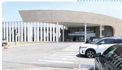
総会会場の嘉島町民会館