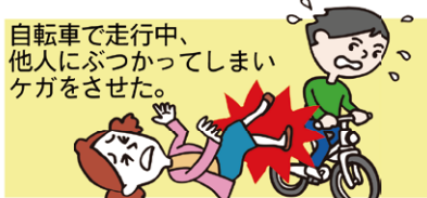
自転車で走行中、他人にぶつかってしまいケガをさせた。

上記の他にも、病氣補償・学校管理下動産補償・育英費用補償・被害事故補償など様々な補償でお子さまをお守りします。*補償内容、保険金額はプランにより異なります。