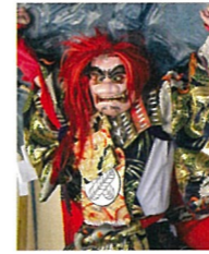
中江神楽保存会 波野子供神楽クラブ